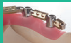
Dolder® Barra en forma de U