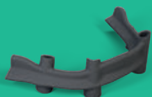
Barra atornillada básica