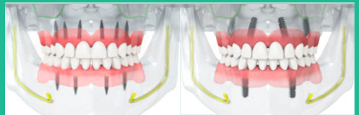
Sistema Straumann® Mini Implant