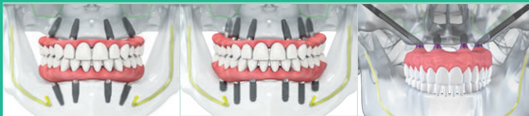
Straumann® Pro Arch con implantes BLT, BLT y TLX