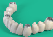
Puente ZrO 2 /PEEK/PMMA